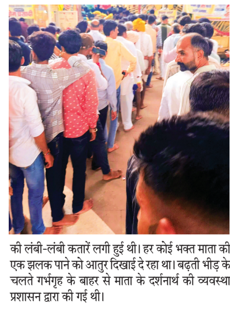
की लंबी-लंबी कतारें लगी हुई थी। हर कोई भक्त माता की एक झलक पाने को आतुर दिखाई दे रहा था। बढ़ती भीड़ के चलते गर्भगृह के बाहर से माता के दर्शनार्थ की व्यवस्था प्रशासन द्वारा की गई थी।

मनोकामना पूर्ति के लिए किए हवन अनुष्ठान कार्य नगर में स्थित मां बगलामुखी मंदिर के संबंध में मान्यता है कि किसी भी भक्त द्वारा अपनी मनोकामना के लिए मंदिर परिसर में हवन अनुष्ठान करवाया जाता है तो उस भक्त की मनोकामना शीघ्र पूर्ण होती है। इसी को लेकर भक्त अपनी मनोकामना लेकर मां के दर पर विशेष हवन-अनुष्ठान करवा रहे हैं। रविवार को माता के दर्शनार्थ के लिए पहुंचे कई भक्तों द्वारा माता के दर्शनार्थ उपरांत मां के दरबार में हवन-अनुष्ठान कार्य भी किया जिसके चलते पुरा मंदिर परिसर मंत्रोच्चार से गुंजायमान हो रहा था। मां का हुआ आकर्षक श्रृंगार मां बगलामुखी मंदिर पर माता रानी का प्रतिदिन आकर्षक श्रृंगार कर माता को मिन्न-मिन्न रंगों की वृक्ष ओढ़ाई जाती है। रविवार को भी पुजारी परिवार द्वारा माता रानी का स्वर्ण श्रृंगार कर पीले रंग की वृक्ष ओढ़ाई गई थी जोकि भक्तों को बरखस ही अपनी ओर आकर्षित कर रही थी।