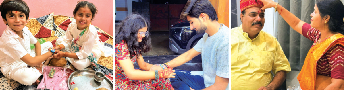
हरिभूमि न्यूज | कानड़

भाई बहन के अटूट स्नेह का पावन पर्व रक्षाबंधन शनिवार को नगर में हर्ष उल्लास से मनाया गया। सावन की पूर्णिमा पर पूरे परिवार के साथ बहनों ने रक्षा सूत्र से भाइयों की कलाईयां सजाईं। बहनों ने अपने भाई को राखी बांधी, फिर भाल पर तिलक लगा कर मुंह मीठा कराकर भाई की लम्बी उम्र की कामना की। राखी बंधवाने के बाद भाई ने बहन को रक्षा का आशीर्वाद एवं उपहार दिया। बहनों ने राखी बांधते समय भाई को लंबी उम्र एवं सुख उन्नति की कामना की। महंगाई पर भारी रही आस्था, बहनों ने जमकर खरीदी सामग्री: हर साल की अपेक्षा इस वर्ष