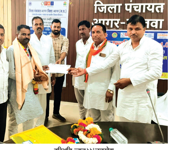
नलखेड़ा